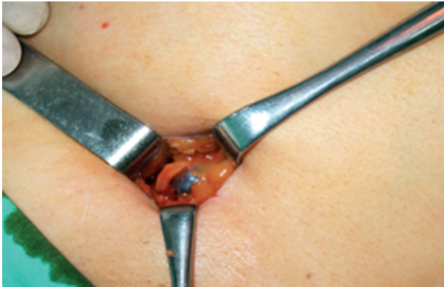
Resim 2. Mavi boya sonrası bekçi lenf düğümünün görünümü

deneyim gerektirebilmektedir. Ayrıca mavi boyanın lenfatik kanallardan hızlı geçişi nedeniyle cerrahın hızlı çalışması gerekir, hızlı geçiş nedeniyle çıkarılan BLD dışı lenf düğümlerinin sayısı artabilir, koltuk altı dışındaki bekçi lenf düğümleri saptanmayabilir (1).