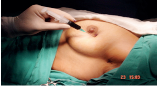
Resim 1. Mavi boya cerrahiden 10 dakika önce 3-5 mL mavi boya tümör çevresine veya subareolar bölgeye uygulanır

Mavi boya komplikasyonları; alerjik reaksiyonlar, anafilaksi, deride kızarıklık, ürtiker, deride geçici veya kalıcı iz, deri ve yağ nekrozu, pulse oksimetrede düşük oksijen basıncı ölçümü, hipotansiyon olarak sıralanabilir. Alerjik reaksiyonların görülme sıklığı %0,5-2,7 arasında değişmektedir (40). Derinde yerleşmiş bekçi lenf düğümlerini mavi boya ile görüntülemek veya bu lenf düğümünü tespit edip çıkarmak zor olabilmekte,