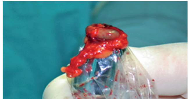
Resim 3. Çıkarılan lenf düğümündeki radyoaktivitenin dedektör ile doğrulanması

Sekiz bin elli dokuz hastayı içeren BLDB ile yapılan 69 çalışmanın derlemesinde BLD'nin %95 hastada %7,3'lük yalancı negatiflik oranı ile tespit edildiği bildirilmiştir (41,42). Mavi boya ve radyokolloidin birlikte kullanılmasının tek başına boya kullanılan tekniğe göre BLD'nin saptanmasında daha düşük yalancı negatiflik oranı ile birlikte daha yüksek başarı sağladığı gösterilmiştir.